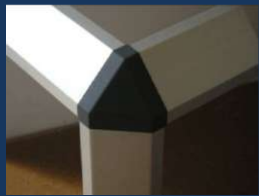
Equerre 3 départs pour profilés pan coupé 45°, ou embouts plats