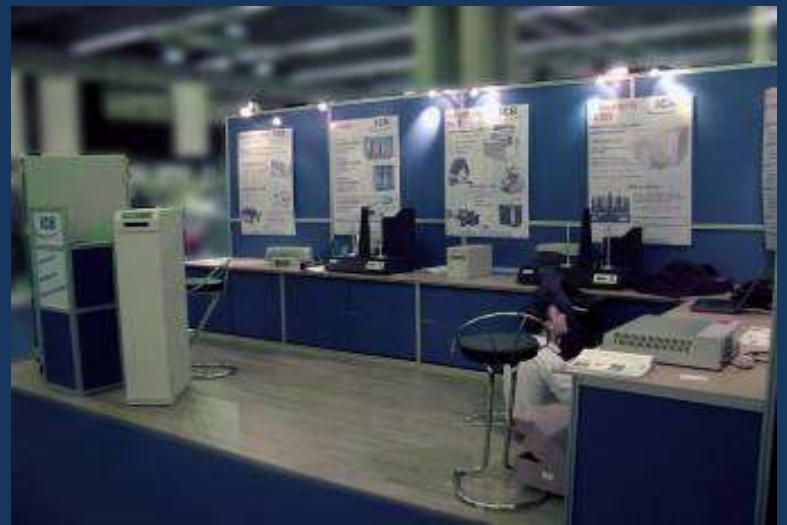
>> "Espace réception" –angles en 90x90mm Plaques transparentes en PET incassable

Voir également : Cloisons Présentoirs Mobilier techniques Rambardes