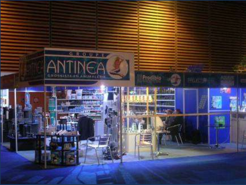
Avec panneaux PVC rigide allégé - Réserve avec porte