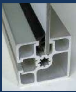
Joint de calage-étanchéité