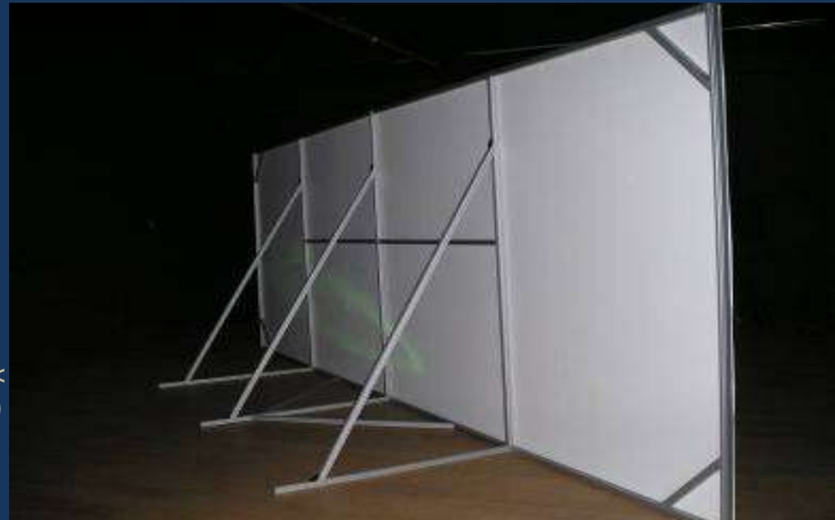
Ecran (toile tendue sur << structure démontable en profilés)

Voir également : Cloisons Présentoirs Mobiliers techniques Rambardes