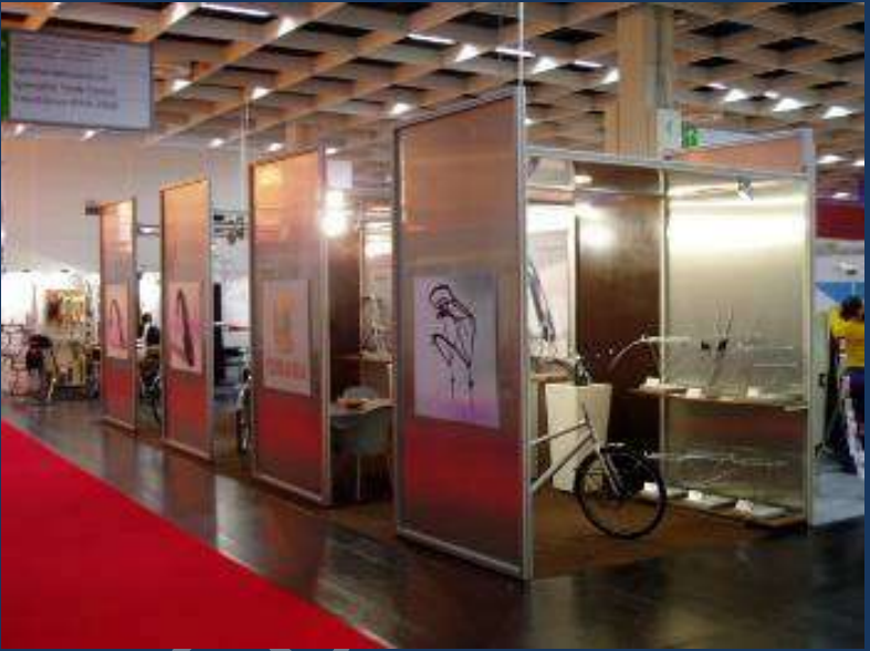
Cadres avec plaques aluminium rigide