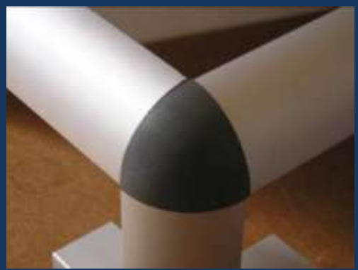
Equerre 3 départs pour profilés ¼ de rond, ou embouts plats