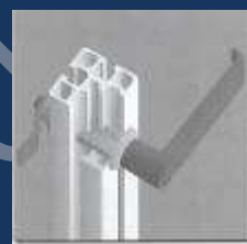
Poignées de porte, serrures, loquets...