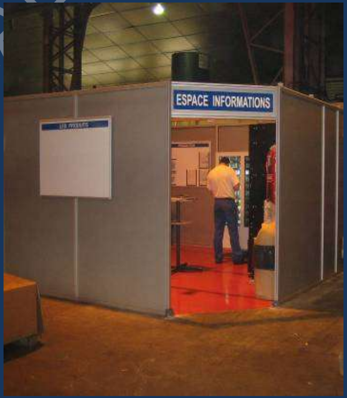
∨ Avec panneaux "sandwich" ALUBOND rigide