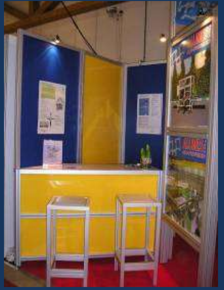
"Espace Bar" et réserve avec porte – panneaux PVC allégé