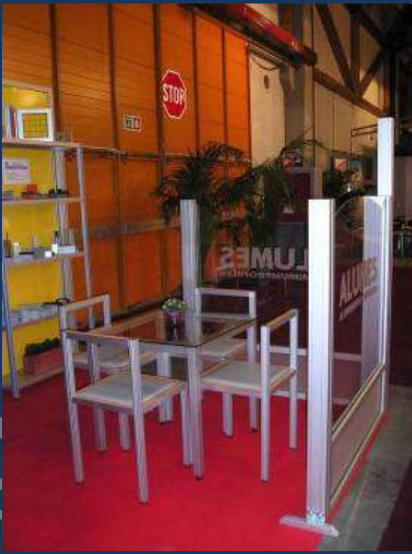
∨ Avec mobilier en profilé aluminium modulaire