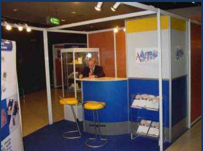
Avec panneaux PVC rigide allégé