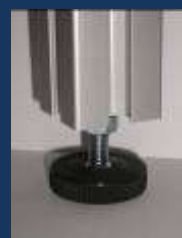
Pieds de réglage