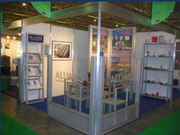
Avec panneaux PVC rigide allégé << Plan de travail mélaminé au dessus d'armoires à Portes coulissantes