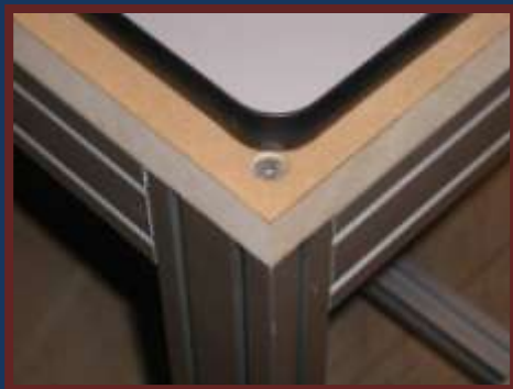
Table-bâti support de marbre >> en profilés 180x90mm, pour expériences exigeant une totale stabilité, avec pieds de réglage de l'assiette