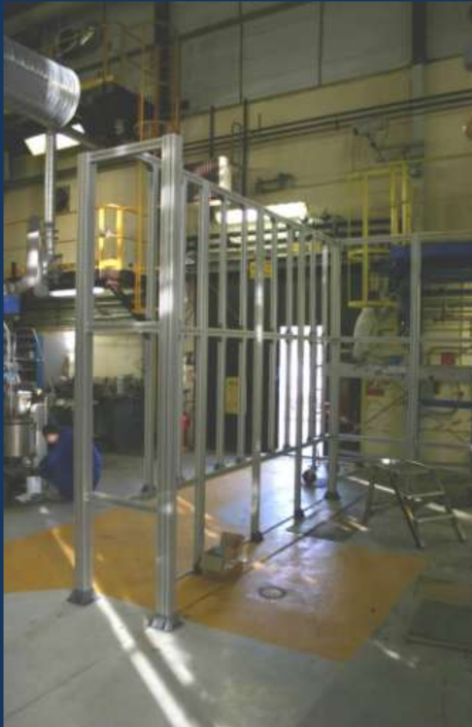
Skid fixe à dimensions